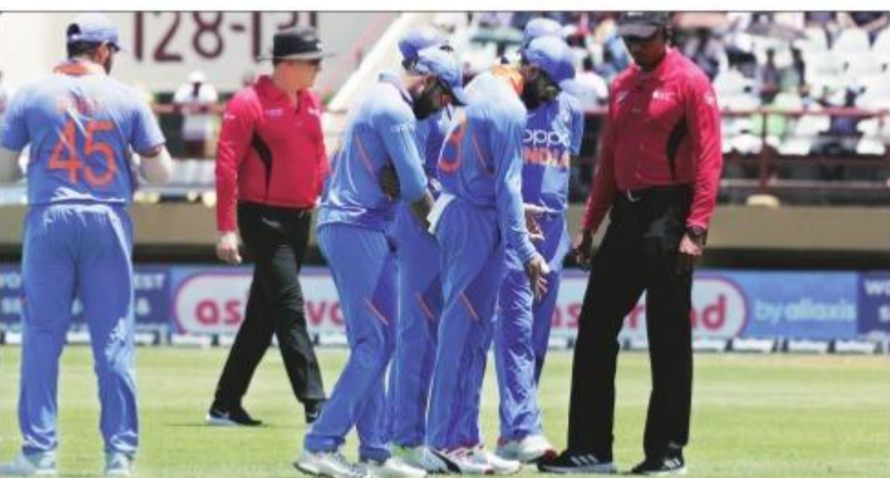
मैच के दौरान पिच का आकलन करते भारतीय खिलाड़ी।

दोबारा मैच शुरू होने पर वेस्ट इंडीज ने जब 13 ओवर में एक विकेट पर 54 रन बनाए थे तो फिर तेज बारिश होने लगी और मैच रोकना पड़ा। यह दोबारा शुरू नहीं हो पाया। इस समय सलामी बल्लेबाज एविन लुईस 40 जबकि शाई होप छह रन बनाकर खेल रहे थे। सलामी बल्लेबाज क्रिस गेल 31 गेंद में चार रन